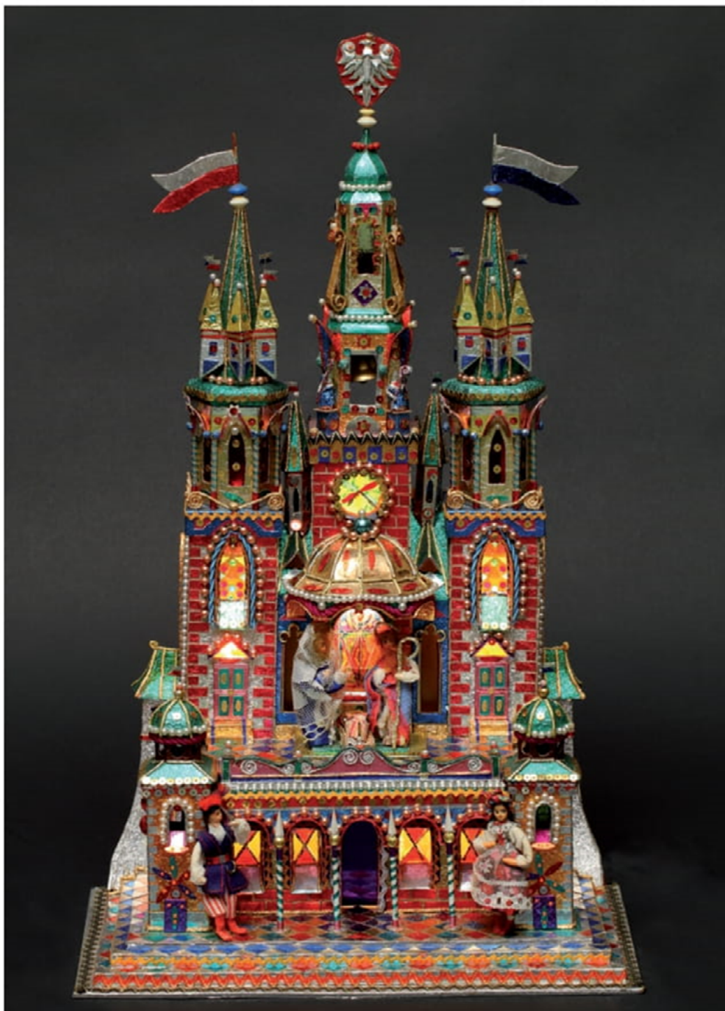
AUTOR SZOPKI: Stanisław Paczyński 1991