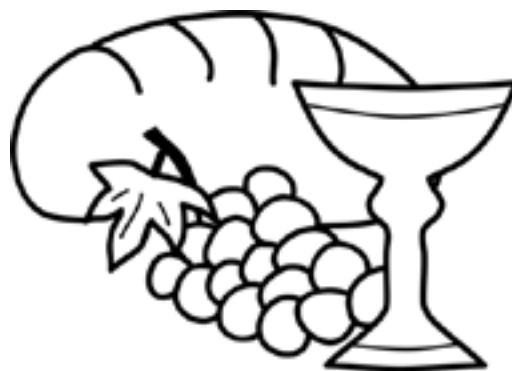
komunia pod dwiema postaciami