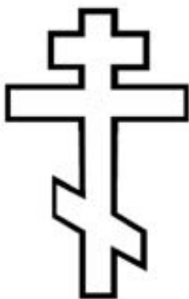
przyjęcie zaraz po chrzcie sakramentu bierzmowania