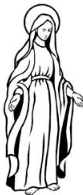
uznanie niepokalanego poczęcia (bez grzechu) Marii