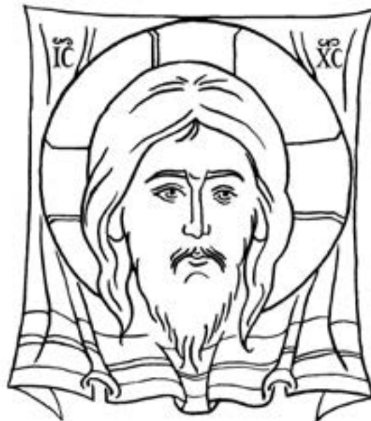
kult obrazów i relikwi, ale brak kultu rzeźb