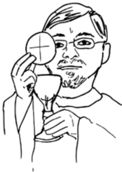
zakaz małżeństw duchownych