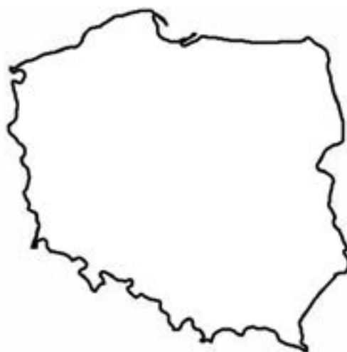
dominująca religia w Polsce