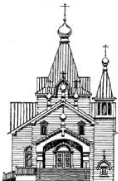
świątynia nazywa się cerkiew