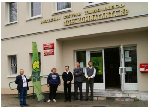
Zajrzyj do Huty 2017