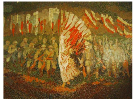
Widok na trzecią salę Muzeum