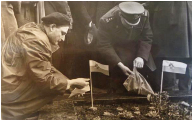
Pobieranie ziemi do urn