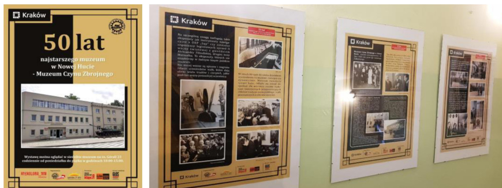
Wystawa 50 lat najstarszego muzeum w Nowej Hucie – Muzeum Czynu Zbrojnego

W roku 2020 uczestnicy Pracowni muzealniczej pod okiem terapeuty oraz we współpracy z kierownictwem Małopolskiej Fundacji Dom Kombatanta RP Muzeum Czynu Zbrojnego przygotowali wystawę poświęconą 50-tej rocznicy oficjalnego otwarcia Muzeum Czynu Zbrojnego. Z przygotowanymi materiałami można obecnie na co dzień zapoznać się w siedzibie Muzeum.