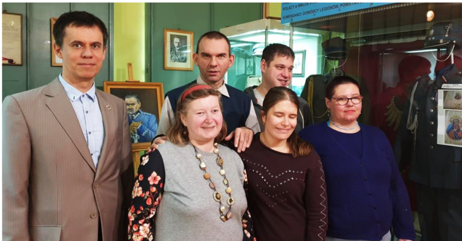
Pracownia obsługi Muzeum Czynu Zbrojnego z gościem Muzeum

Rokrocznie Muzeum Czynu Zbrojnego odwiedzane jest przez blisko dwa tysiące osób, z czego około połowę stanowią członkowie grup zorganizowanych (uczniowie szkół i słuchacze studiów wyższych, przedszkolaki, a także uczestnicy spotkań w Klubie Integracji Społecznej, pokrewnej WTZ instytucji wsparcia). Ponadto uczestnicy pracowni mają sposobność spotkać się z zagranicznymi gośćmi, w tym z tak odległych krajów jak Nowa Zelandia, Argentyna, Kanada czy Japonia. Uczestnicy Pracowni muzealniczej towarzyszą gościom odwiedzającym Muzeum, a w licznych przypadkach sami ich oprowadzają. Bardzo wielu gościom muzeum spodobało się to, iż osoby z niepełnosprawnościami były ich przewodnikami. Uznanie dla tej inicjatywy płynie też od gości zagranicznych, którzy słuchali wypowiedzi przygotowanych przez uczestników po polsku i przetłumaczonych później na język obcy. Niektórzy z nich podkreślali, że to dobra inicjatywa, z którą dotąd się nie spotkali w swoich podróżach po świecie. Świadczą o tym wpisy do ksiąg pamiątkowych Muzeum, a w szczególności relacja z wizyty w Krakowie gości z Hiszpanii.