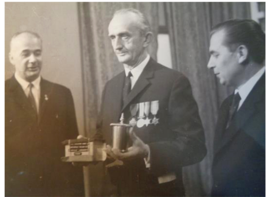
Konsul Francji przekazuje urnę z ziemią