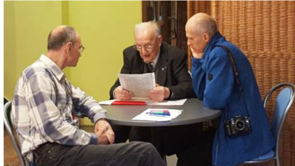
Przygotowania do Zajrzyj do Huty 2017

Każdego roku we wrześniu wiele placówek kulturalnych z Nowej Huty włącza się w organizowane przez nowohucki oddział Muzeum Krakowa wydarzenie „Zajrzyj do Huty”. Robią to również Warsztaty Terapii Zajęciowej wraz z Muzeum Czynu Zbrojnego. Pracownia muzealnicza przygotowuje we współpracy z kombatantami stosowną wystawę, która wzbogaca stałe ekspozycje Muzeum, a także oprowadzają zwiedzających po Muzeum oraz dla rodzin z dziećmi organizują quizy i zabawy, które korespondują z tematem przewodnim przygotowanej na dany rok wystawy.