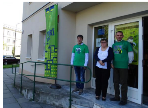
Zajrzyj do Huty 2019

W roku 2020 uczestnicy Pracowni muzealniczej pod okiem terapeuty oraz we współpracy z kierownictwem Małopolskiej Fundacji Dom Kombatanta RP Muzeum Czynu Zbrojnego przygotowali wystawę poświęconą 50-tej rocznicy oficjalnego otwarcia Muzeum Czynu Zbrojnego. Z przygotowanymi materiałami można obecnie na co dzień zapoznać się w siedzibie Muzeum.