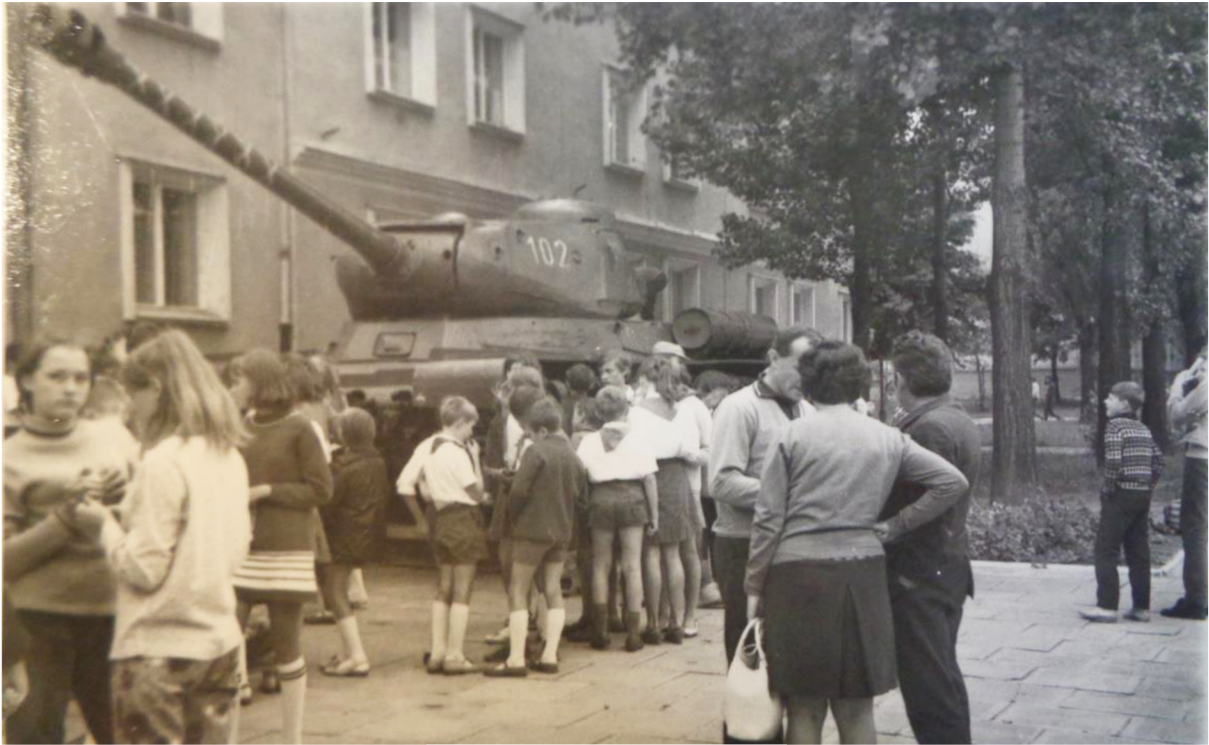
Czołg w latach 70-tych XX w.