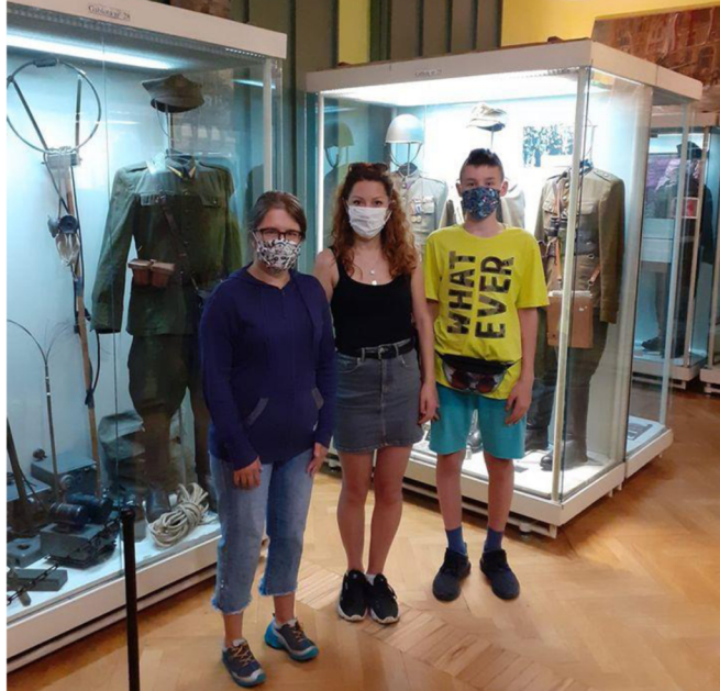
Ania z gośćmi Muzeum