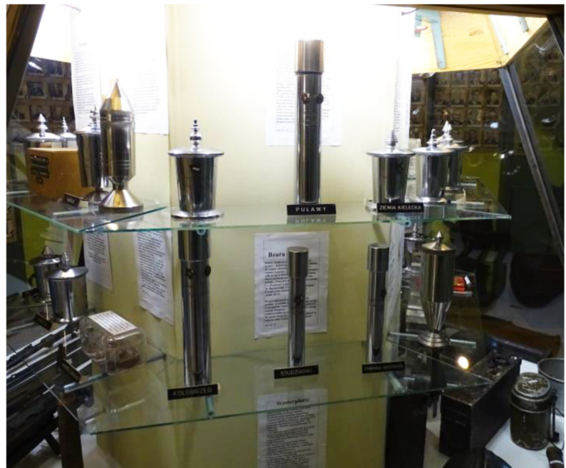
Obecny wygląd urn w Muzeum Czynu Zbrojnego